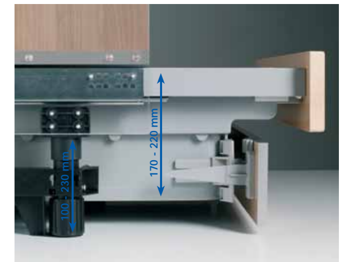
Basis Schubkasten in den Höhen 170 mm und 220 mm. Basic drawer in the height of 170 mm and 220 mm.